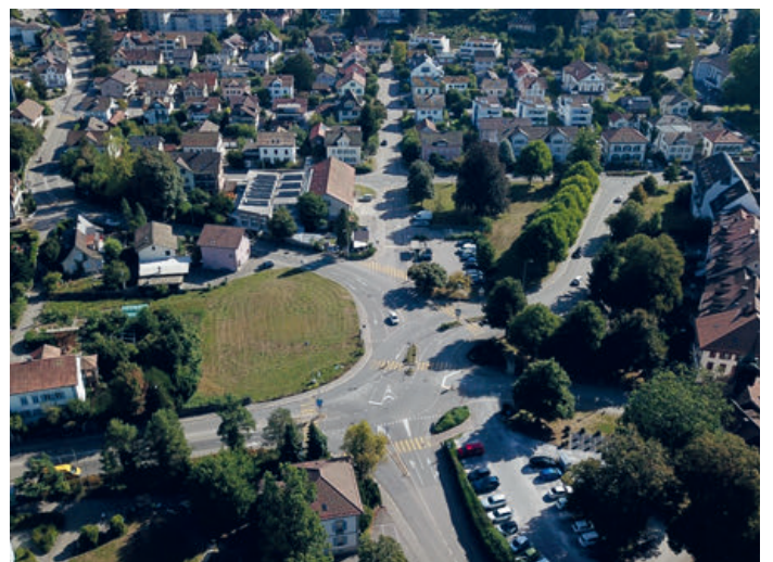
Blick auf die Untere Vorstadt aus der Vogelperspektive

Das zukünftige Stadtquartier in Zofingen wird nicht nur ein neues Zuhause für viele Menschen, sondern auch ein Symbol für modernes, nachhaltiges Bauen und urbanes Leben im 21. Jahrhundert. DOMUM ist sehr stolz darauf, Teil dieses ehrgeizigen Projekts zu sein und die Zukunft der Stadt Zofingen aktiv mitzugestalten.