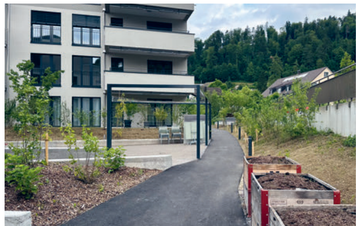
DOMUM Turbenthal Garten

DOMUM entwickelt auch an anderen Standorten Projekte in direkter Nachbarschaft zu bestehenden Pflegeinstitutionen – eine Win-win-Situation für alle Beteiligten. Denn häufig fehlen in Pflegeinstitutionen Alterswohnungen, wodurch die moderne Wohnform «Wohnen mit Service» nicht umgesetzt werden kann.