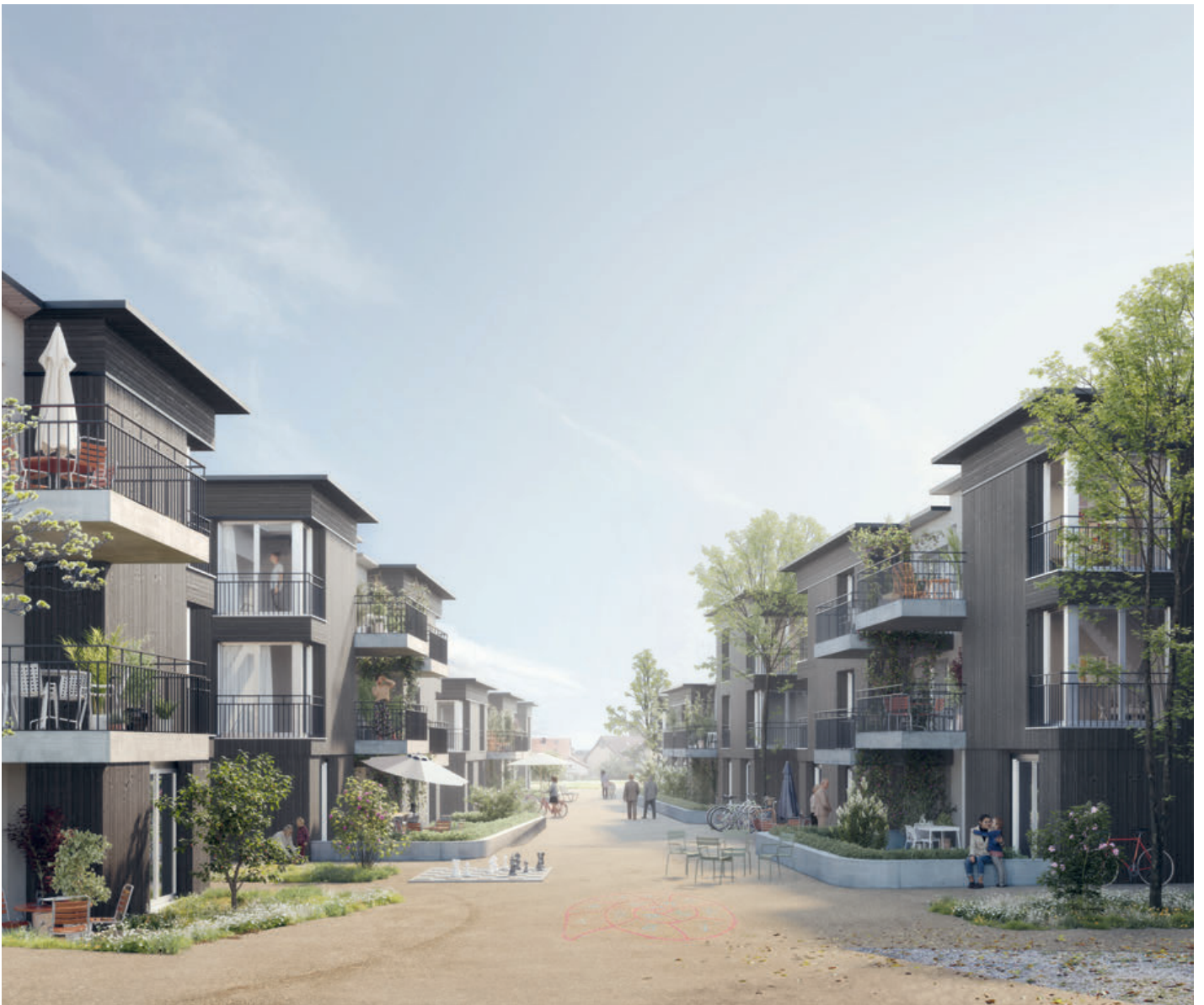
Visualisierung DOMUM Schinznach