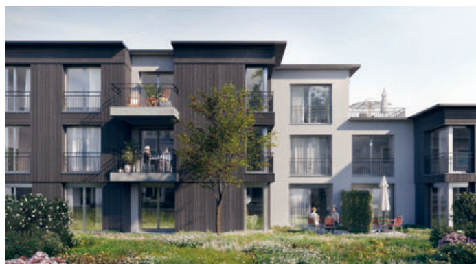
Visualisierung DOMUM Schinznach

Die Baufreigabe wurde erteilt und mit den Vorbereitungsarbeiten (Ausbau Gartenweg) wurde begonnen.