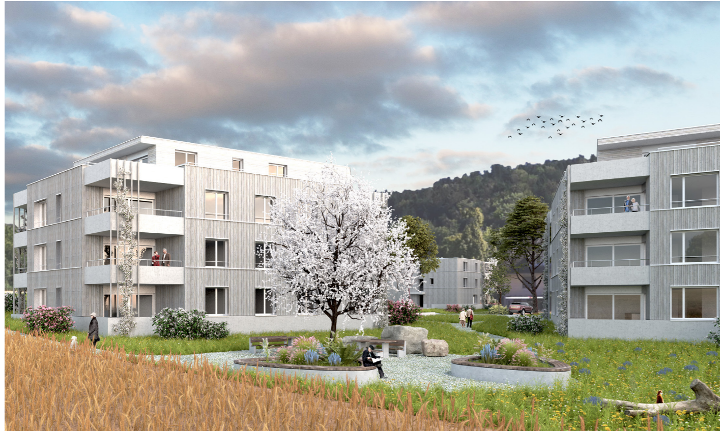
DOMUM Winterthur Aussenperspektive